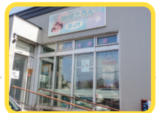
せせらぎサロン会場の「地域サロンぼっけ」