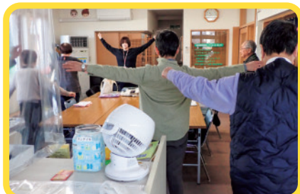
せせらぎサロンから(みんなでラジオ体操)

昨年、期間限定の介護予防教室に参加した皆さんから、引き続き活動したいとの強い要望があり、地域サロンを設立しました。名称は「せせらぎサロン」です。火曜日の10時半から「ワーカーズ・ぼっけ」さんが所有するスペースをお借りして、ラジオ体操、脳トレなどを行っております。