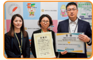
明治安田生命保険 相互会社 札幌支社 様