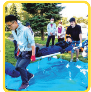
担架を使用しての防火避難訓練