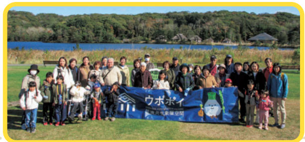
「ウボイ」へのバス旅行

参加者の方々からは、大変、好評の声を頂いています。これからも、高齢者の皆さんの交流の場を広げていきたいと思ひます。