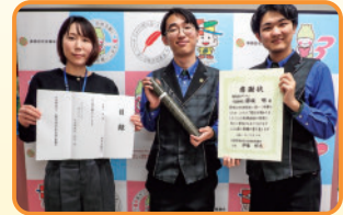
ダイナム北海道 札幌清田店 様