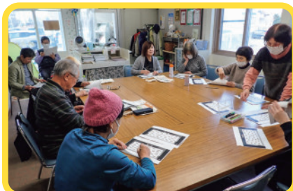
せせらぎサロンから(脳トレにチャレンジ!)

参加者の方々からは、大変、好評の声を頂いています。これからも、高齢者の皆さんの交流の場を広げていきたいと思ひます。