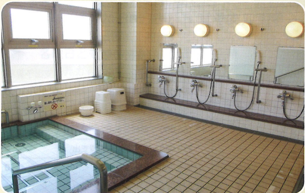
お風呂は1回200円で月・水・金曜日に利用できます。4交代制となりますので詳細についてはお問い合わせください。