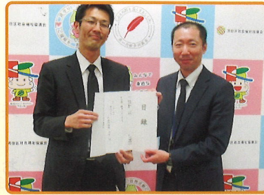
株式会社ダイナム清田店様からのご寄付

生活用品・お菓子等寄付をいただきました。いただいた物品は地域行事、清田区内障がい関係事業所等に寄付させていただきました！