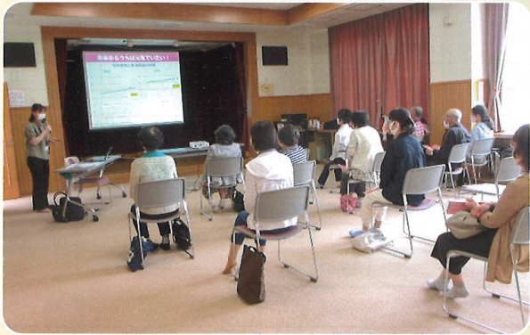
健康セミナーや医療講話を定期的に開催しています。