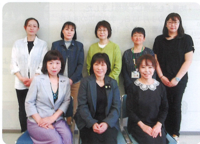
清田区主任児童委員の皆さん

この場で、各地区の主任児童委員同士が情報共有を行うことで今後の活動に活かされています。