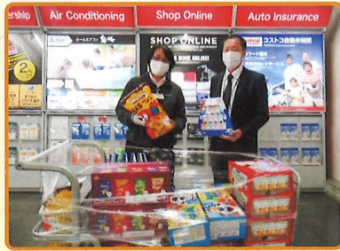
コストコホールディングス様からのご寄付

子ども用文具やお菓子等寄付をいただきました。いただいた物品は、清田区内の子育て事業等に寄付させていただきました！