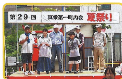
2024年の夏祭りから (交通指導員4人に子ども会代表が感謝の言葉)

当時は、若い世代の会員が多かったこともあり、その積極的な関わりが、町内会の行事等の企画・運営を支える大きな力となっていました。最近では、高齢者の会員の割合が増えて、担い手不足は否めませんが、そうした状況にあるからこそ、相互の支えあいの基本となる町内会取り組みは、地域住民にとって大切な意味を持っています。