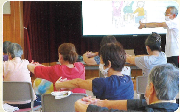
理学療法士による体にやさしい体操教室を毎月実施しております。