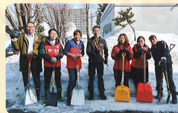
【ちょこっと除雪ボランティア】

新規事業としては、「ちょこっと除雪ボランティア」を開始し、冬季のスポット除雪として、間口の幅を広げたり、物置までの通路除雪等を登録ボランティアや学生、企業のご協力による取組み実施を試みました。