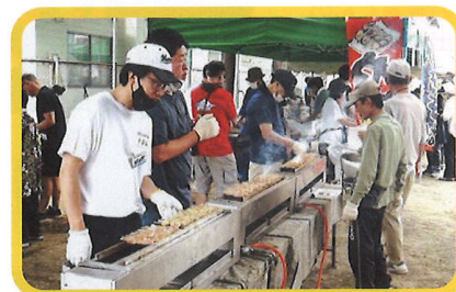
2024年の夏祭りから (一生懸命に焼き鳥を焼くお父さんたち)