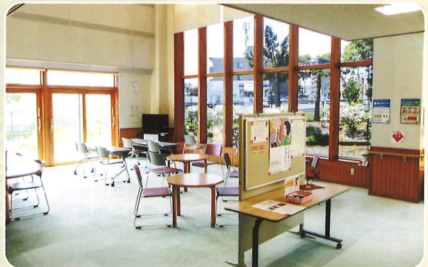
ロビーは休憩や昼食などでご利用ください。ウォーキング途中の休憩場所としてもお立ち寄りください。