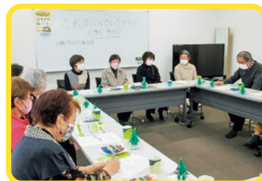
令和5年12月15日の発会式

2月には、さくらもちづくりとひな祭りにちなんだ和紙による手作りのひな人形をつくり、わたしました。