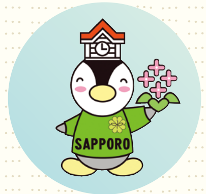
民生委員・児童委員 ご当地キャラクター「ミンジー」 札幌市版

困ったことや心配ごと、援助を必要とする相談には、住民の立場にたって対応します。行政や専門機関、ボランティアなど地域活動とあなたをつなぐパイプ役です。また、相談内容に応じて福祉サービスに関する情報の提供や、社会福祉施設や社会福祉に関する活動を行う人などとの連携で問題解決のお手伝いもします。