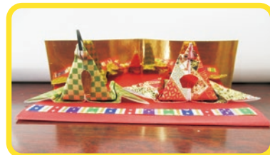
和紙による手作りのひな人形