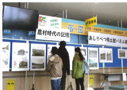
郷土館のパネル写真展 =2月4日、清田区役所

「灯りカフェ」は、区役所前広場と厚別(あしりべつ)神社にスノーキャンドルを灯し、区役所ロビーでコンサートを開催した清田地区の賑わい作りのイベントでした。