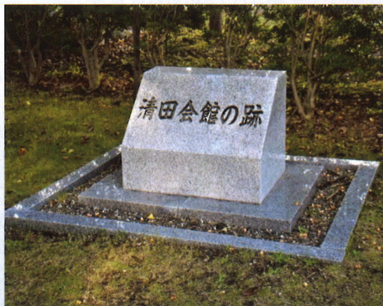
厚別神社境内にある「清田会館の跡」碑

厚別青年会は、労働・研修・奉仕・地域貢献の精神で、地域の様々な活動の推進役となって郷土の発展に尽くしました。厚別神社のお祭りでも、青年たちが頑張ってお祭りを盛り上げました。かつての青年たちの活動や思いが、この小さな「清田会館の碑」に詰まっているのだと思うと、感慨深いものがあります。(川島亨)