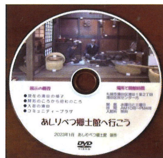
動画「あしりべつ郷土館へ行こう」のDVD