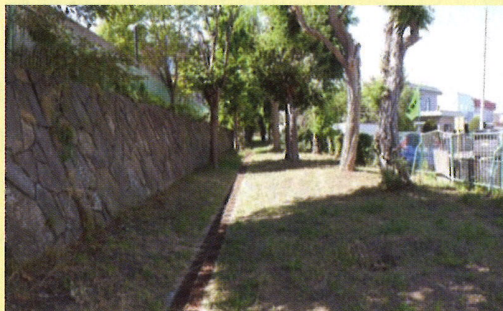
吉田用水跡=北野3条3丁目