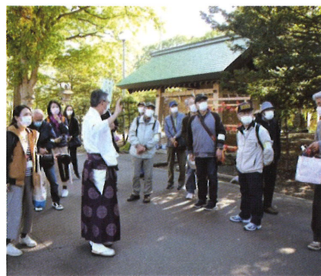
厚別神社の宮司さんから話を 聴く参加者=厚別神社