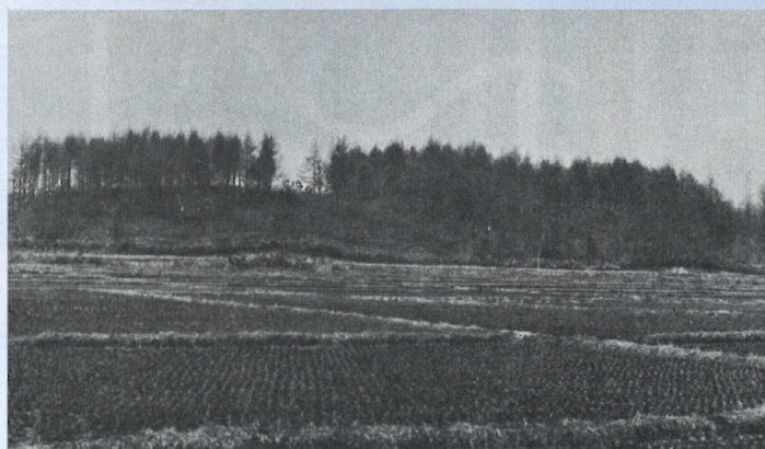
北野にあった青年の山