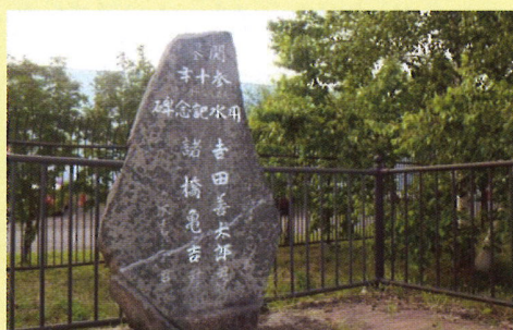
吉田用水記念碑=厚別川左岸のコカ・コーラ裏