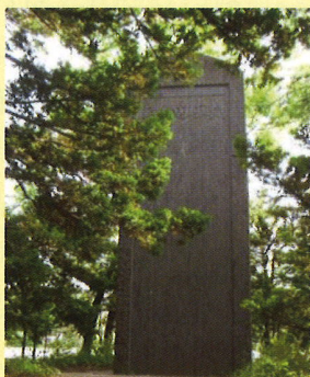
清田小学校前に建つ開拓功労碑

清田150年のうち、明治30年代頃から農村時代が長く続きました。しかし、昭和40年代以降のこの50年間は都市化、宅地化の時代です。今や清田区は、札幌の緑豊かな住宅地として発展しています。1997年には豊平区から分区して清田区が誕生しました。清田区としての歴史も早いもので25年となりました。