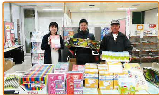
コストコさんからの寄付をからまつ保育園へお渡し

・コストコホールディングス 様 清田区内の方のために役立てて欲しいと、 子ども文具の寄付をいただきました。 いただいた文具は、「認定こども園からま つ保育園」に寄付させていただきました！