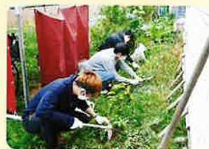
【草取りボランティア】

その他、「学生！！ちょい×2 ボランティアの日」の企画では、札幌国際大学や北星学園大学などの学生が地域の担い手として活躍する機会を設け、新たな活動者をつなげるきっかけを進めました。